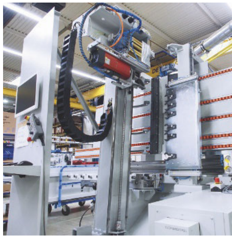
/ Erfolgsmodell: Vertikales CNC-Bearbeitungszentrum vom Typ „Evolution“ in der Endmontage.