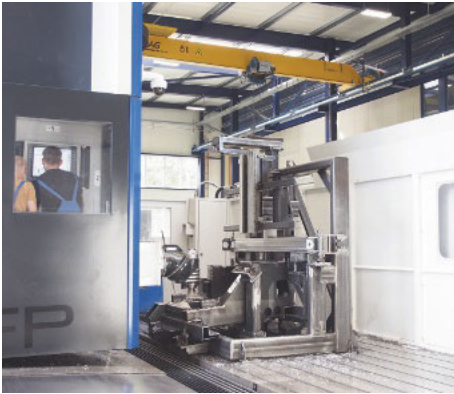
/ Hoch präzise werden auf dem neuen Bearbeitungszentrum Maschinengestelle und mehr bearbeitet.