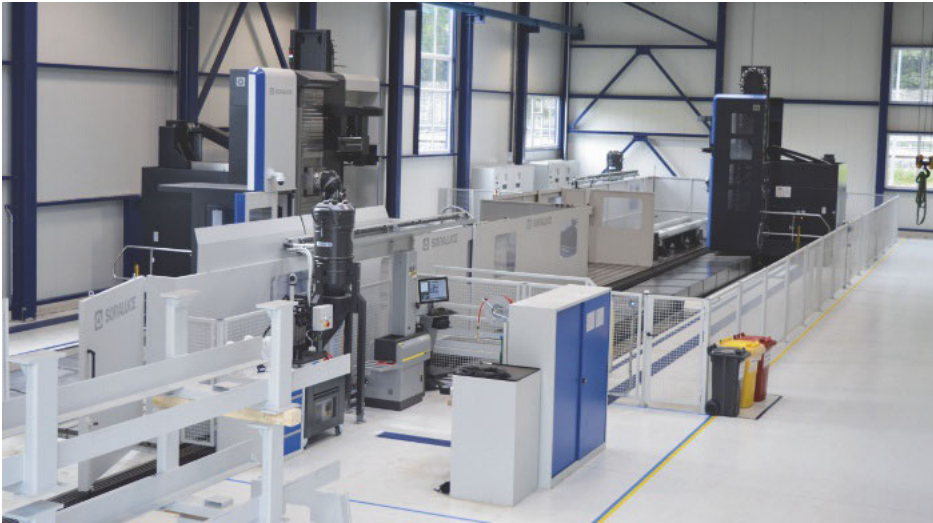
/ Gut gerüstet für weiteres Wachstum: Rund 4,5 Mio. Euro hat die Weinig-Gruppe in den Erweiterungsbau der Holz-Her Maschinenbau GmbH und das neue, 30 m lange Duplex-CNC-Bearbeitungszentrum investiert.