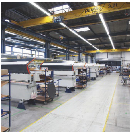
/ Volle Kante: Montage von Kantenanleimmaschinen aller Baureihen. Um die Abläufe und die Qualität ...