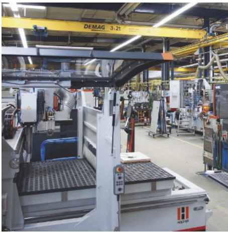
/ Das Voitsberger Werk ist auf hohe Flexibilität getrimmt. Hier: Montagelinie für CNC-Bearbeitungszentren.