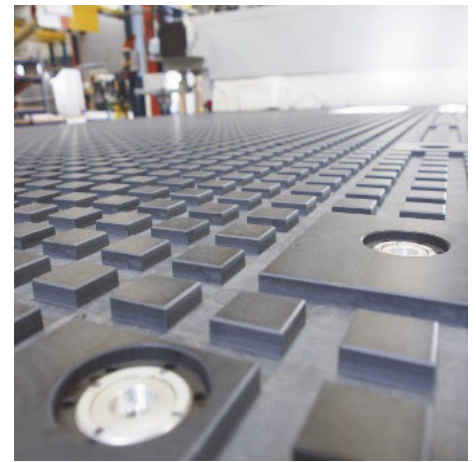
/ Die Rastertische der horizontalen CNCs werden nach ihrer Montage von den Maschinen selber gefräst.