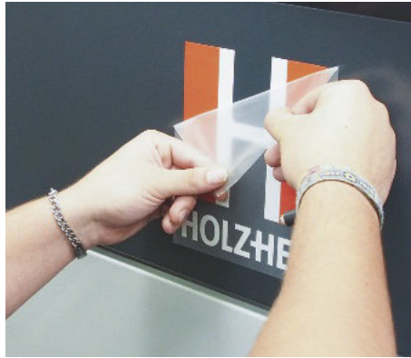
/ Rund 2000 Maschinen werden 2018 in Voitsberg produziert und gehen von dort aus in alle Welt.

Um das seit Jahren bemerkenswert starke Wachstum erfolgreich fortzusetzen, gibt der Spezialist für Maschinen und Systeme zur Holzwerkstoffbearbeitung innerhalb der Weinig-Gruppe weiter richtig Gas. Jüngste Großinvestition im Holz-Her-Produktionswerk Voitsberg/Steiermark ist ein hochmodernes Bearbeitungszentrum, für das eigens eine neue, 1000 m 2 große Erweiterungshalle gebaut wurde. Das Gesamtinvestitionsvolumen liegt bei rund 4,5 Mio. Euro.