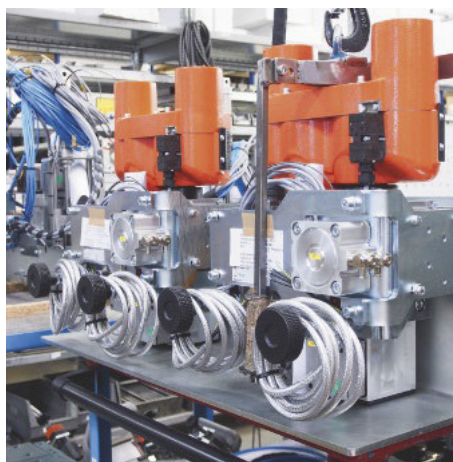
/ ... stets weiter zu optimieren, setzt Holz-Her auf die sogenannte 5S-Methodik. Dabei werden die ...