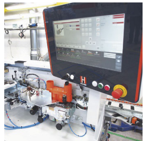
/ ... Mitarbeiter direkt in die Schwachstellenanalyse und Optimierungsprozesse eingebunden.

Ausbildung in unterschiedlichen Berufen.“ Die Werke 1 (Montagen) und 2 (Stahlbau) verfügen über insgesamt 20000 m 2 überdachte Produktionsfläche und ein Vorfürzentrum. Zudem werden von dort aus die weltweite Logistik für Maschinen und Ersatzteile sowie der Einkauf gesteuert.